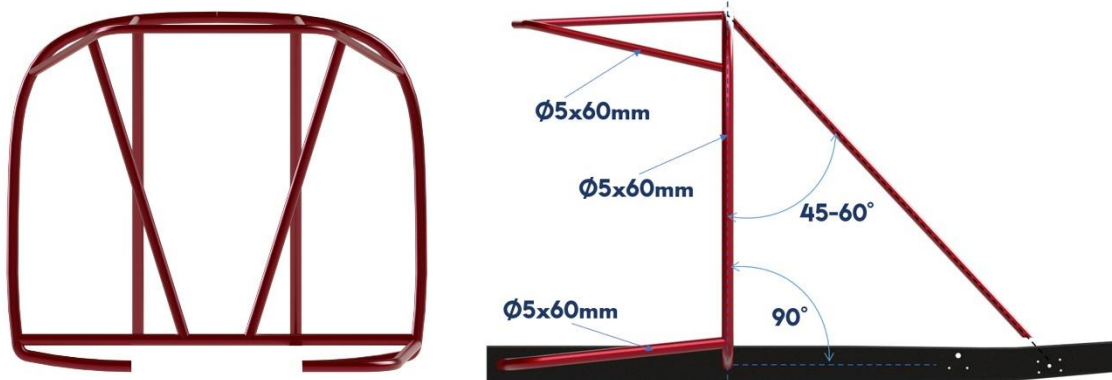
Joonis 9.15 – Ohutusstruktuuride paikenemise ning mõõtude joonis.