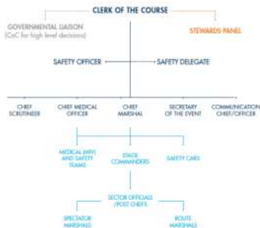
RALLY OFFICIALS' CHAIN OF COMMAND

Võistluse ajal peab ohutusvaatleja osalema kõikidel ohutusmeeskonna instruktaazidel ja lõpliku ohutuskontrolli eesmärgil läbima iga kiiruskatse enne esimese võistlusauto starti.